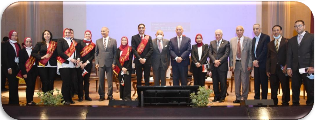
صورة جماعية مع السادة الضيوف بعد انتهاء الندوة