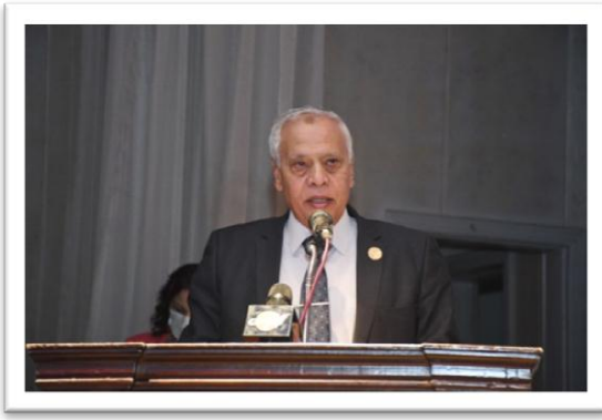
اللواء أركان حرب حمدي بخيت

ثانى درس : كان الأنسان هو رمانه الميزان والفيصل فى مقارنه القوات المضادة لم تكن المعدات ولا التكنولوجيا ولا الأسلحة التى كان يمتلكها الجانبين هى المقياس الذى نقيس به لو تم المقياس على هذا المستوى مصر لم تهزم إسرائيل . مصر كانت تحارب بدبابات من الحرب العالمية الثانية ٣٤ مدفعية كلها