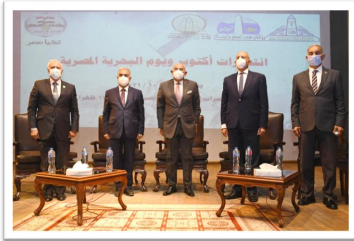
أثناء السلام الجمهوري