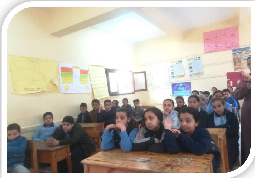
طلاب مدرسة سيدى محمد البحر الابتدائية