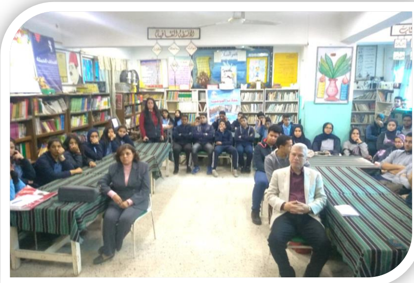
طلاب مدرسة النقراشي الرسمية أثناء حملة التوعية