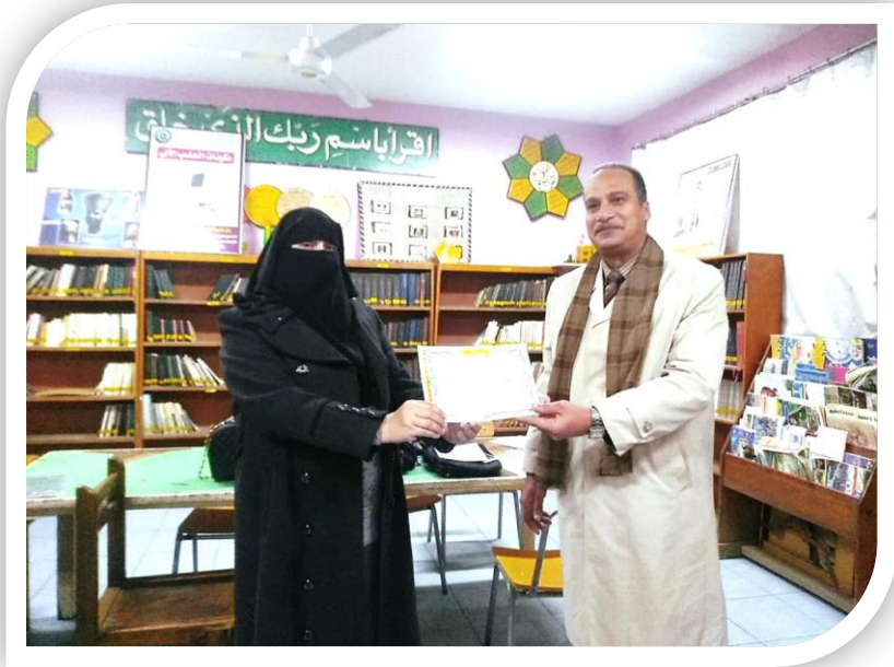
مدير مدرسة أحمد فؤاد الإعدادية بنين مع مدير إدارة التخطيط وتنمية البيئة