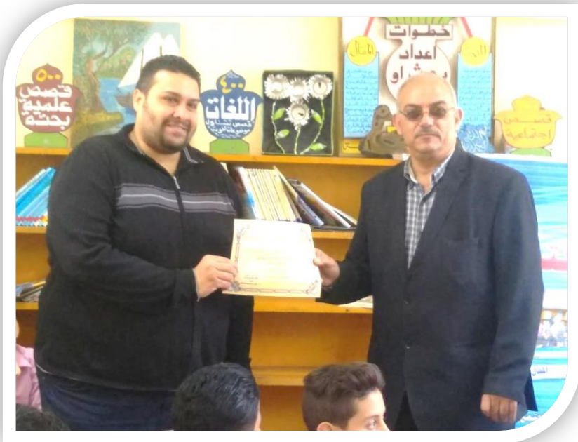
مدير مدرسة عمر مكرم الابتدائية مع مسؤول حملات التوعية بالقطاع