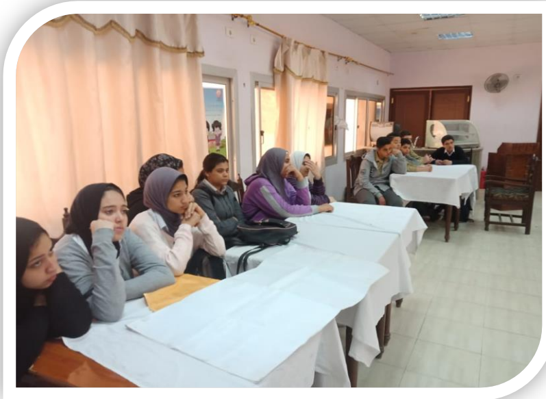
طلاب مدرسة الدرب الأحمر الفندقية الثانوية