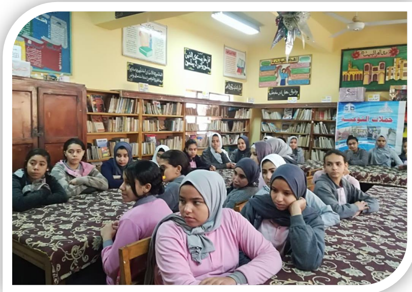
طالبات مدرسة الحسين الإعدادية بنات