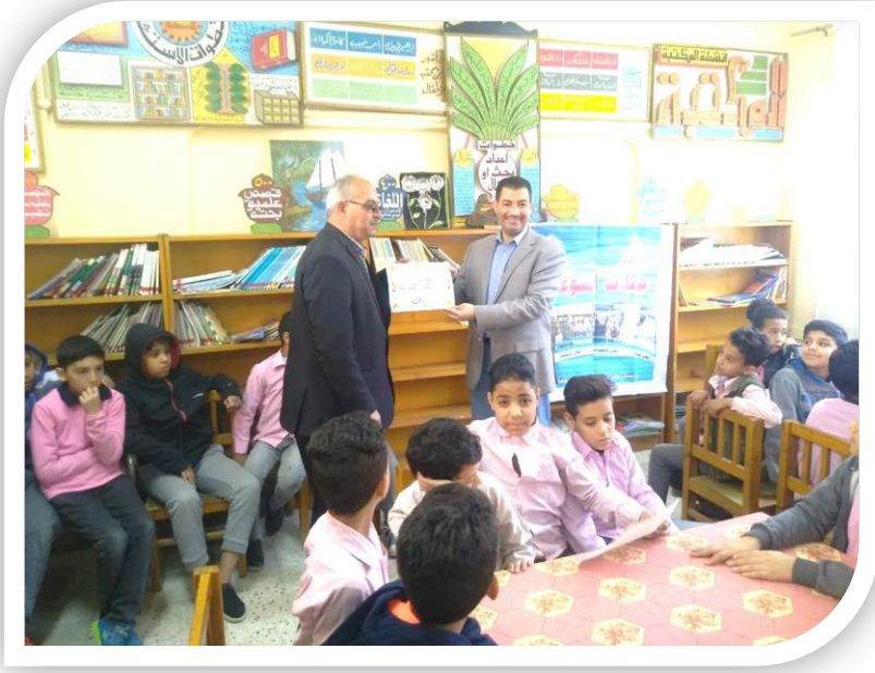
الدكتور/ جمال عبد الناصر مع مدير مدرسة عمر مكرم الابتدائية