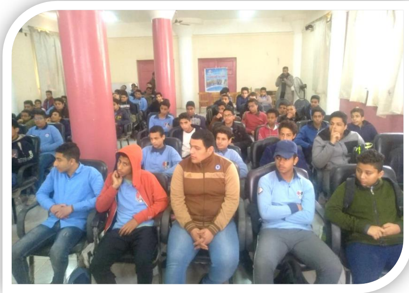
طلبة مدرسة النقرشي الثانوية بنين