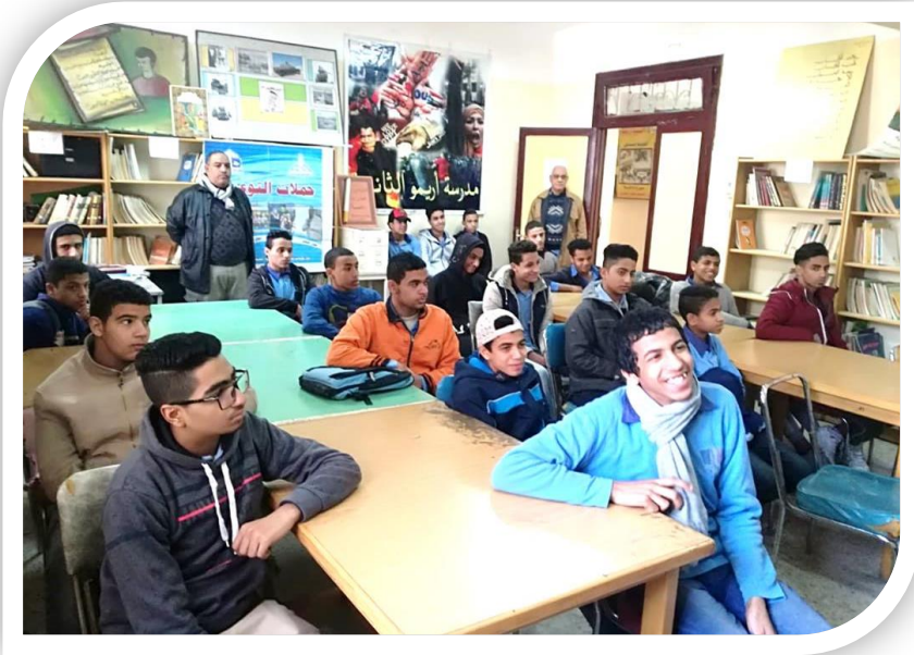
طلبة مدرسة أريمو الثانوية بنين