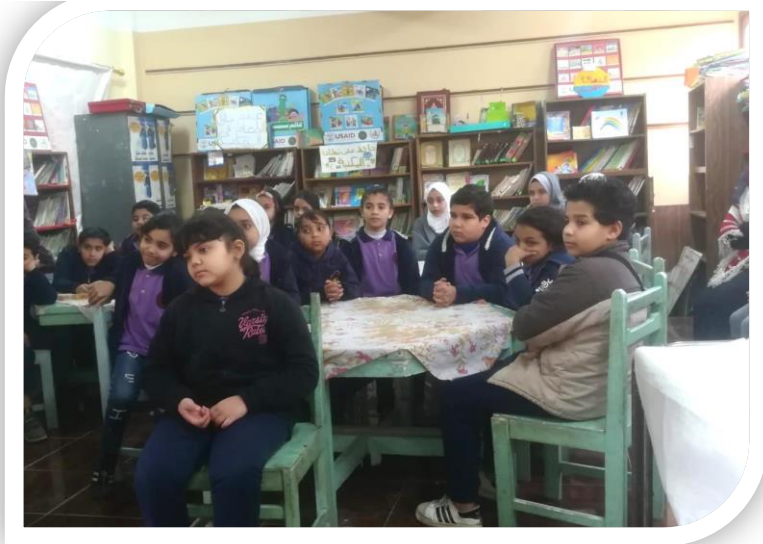
طلاب مدرسة أم المؤمنين الابتدائية