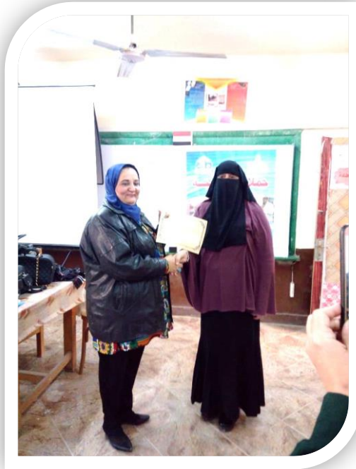
مدير مدرسة السلام الإعدادية بنات مع مدير إدارة التخطيط وتنمية البيئة بالقطاع