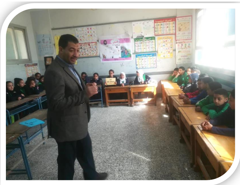
الدكتور/ جمال عبد الناصر مع طلاب مدرسة عمر بن الخطاب الابتدائية